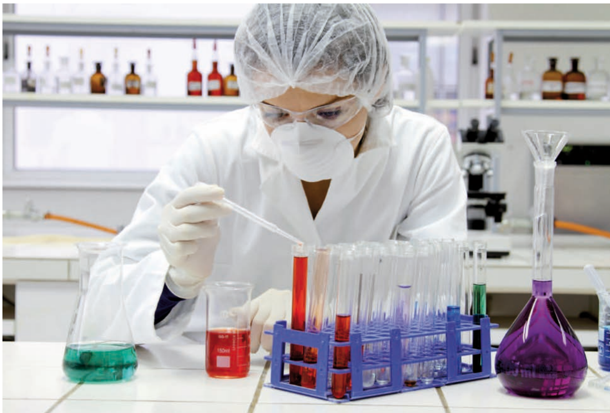
Frauensache: Auch Mädchen haben gute Chancen entlang der gesamten „Wertschöpfungskette Kunststoff“

In der Kunststoffherzeugung werden Rohmaterialien gewonnen und deren Eigenschaften für die verschiedenen Produktionsverfahren optimiert. Zellulose, Kohle, Gas, Salze oder Erdöl – alle diese Rohstoffe werden für die Kunststoffherzeugung genutzt. Auch nachwachsende Rohstoffe und die Wiederverwertung von Abfällen gewinnen hierbei zunehmend an Bedeutung. Das alles erfordert Berufe unterschiedlicher fachlicher Niveaus und Spezialisierungsgrade. Zu den Aufgaben in diesem Bereich gehört es, Rezepturen und Mischungen herzustellen, Laborwerte zu prüfen, Anlagen zu steuern und Messinstrumente zu überwachen.