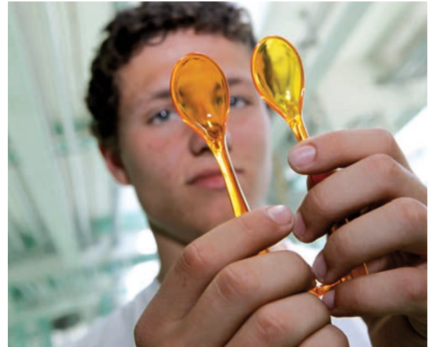
Anfassen erlaubt: Unterricht im SKZ-Schülerlabor

Produkt“ dürfen Schulklassen in Bayern einen Tag lang selbst ausprobieren, wie es sich anfühlt, ein Unternehmen am Markt zu betreiben. Anbieter der Aktion ist das Süddeutsche Kunststoff-Zentrum (SKZ) e.V., dessen Betreiber die Kunststoffindustrie und verwandte Branchen sind. „Wir wollen das Interesse an technischen Berufen wecken und jungen Menschen die Perspek-