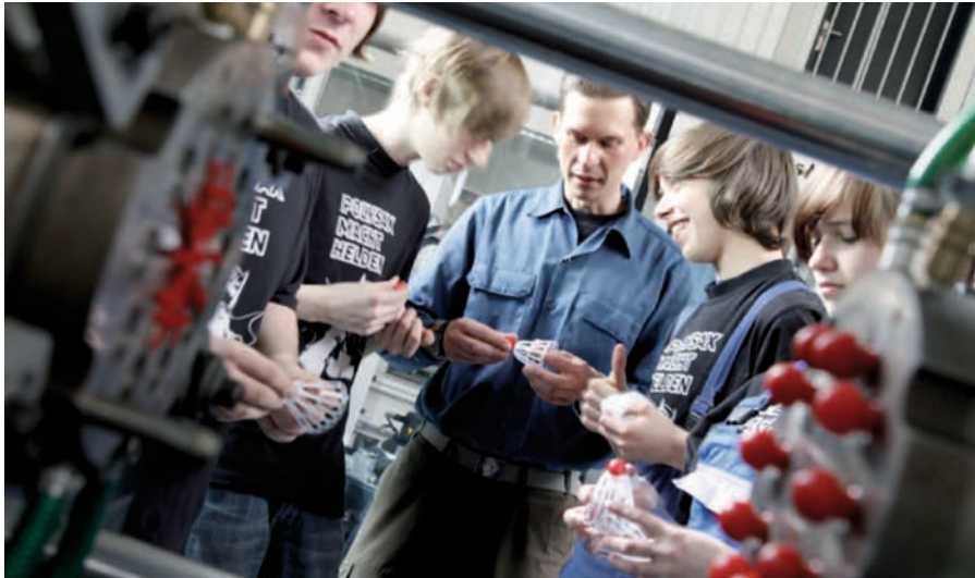
Anschauungsunterricht: Kunststoff-Azubis bei der Verbundausbildung im Technikum Bautzen

Die traditionsreiche Oberlausitzer Kunststoffindustrie beliefert viele namhafte Fahrzeughersteller, produziert aber auch Kunststoffrohre, Badmöbel oder Verpackungen. Das JOBSTARTER-Projekt POLYSAX trägt durch eine attraktive Verbundausbildung zu mehr Zukunftssicherheit der Branche bei. Ein Projektbericht von Kerstin Ganz.