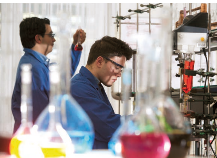
Keine Hexerei: Azubis analysieren Chemikalien

Partheymüller: Gesucht werden Fachkräfte und Auszubildende in allen Bereichen: Verfahrensmechaniker/-innen für Kunststoff- und Kautschuktechnik,