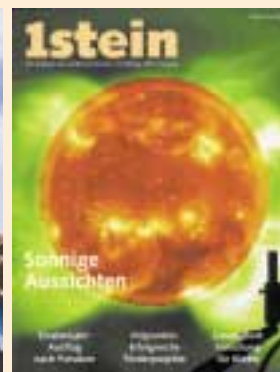
Ausgabe Mai 2005

Sind Sie auch an den bisher erschienenen Ausgaben der Reihe 1stein interessiert?