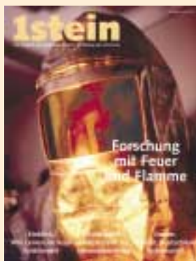
Ausgabe Juni 2004