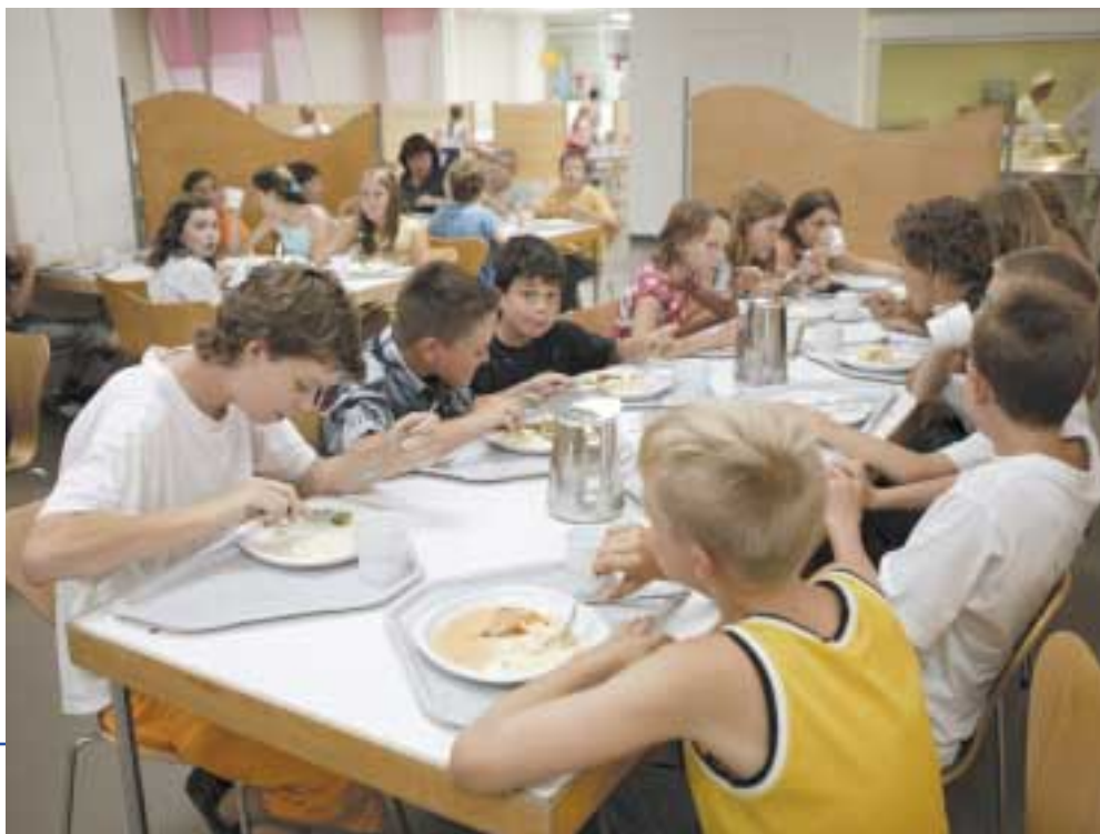
Das gemeinsame Essen ist für die Bodensee-Schüler in Friedrichshafen ein wichtiger Teil des Tages

Davon sind leider viele Kinder und Jugendliche in Deutschland weit entfernt. Sie nehmen im Durchschnitt zu viel Fett und Zucker, aber zu wenig Obst und Gemüse zu sich. Die Folge: Bereits jeder dritte Heranwachsende leidet an Übergewicht. Die Ernährungssituation vieler Schülerinnen und Schüler muss nach Auffassung des Instituts für ökologische Wirtschaftsfor-