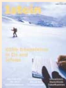
Ausgabe Dezember 2004