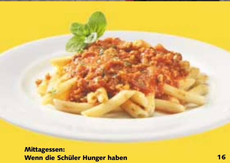
Mittagessen: Wenn die Schüler Hunger haben 16