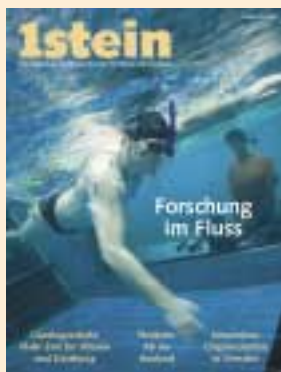
Ausgabe Dezember 2003