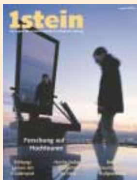
Ausgabe März 2002 (nur noch als Download)