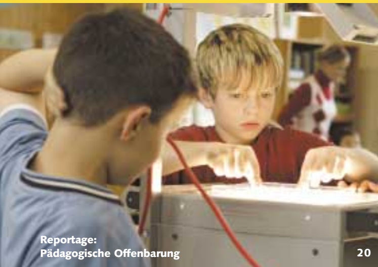
Reportage: Pädagogische Offenbarung 20