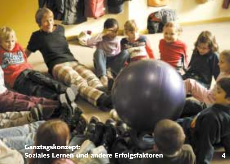
Ganztagskonzept: Soziales Lernen und andere Erfolgsfaktoren 4